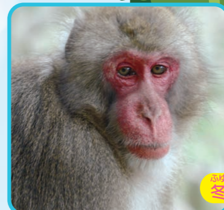
ふゆげ 冬毛のサル