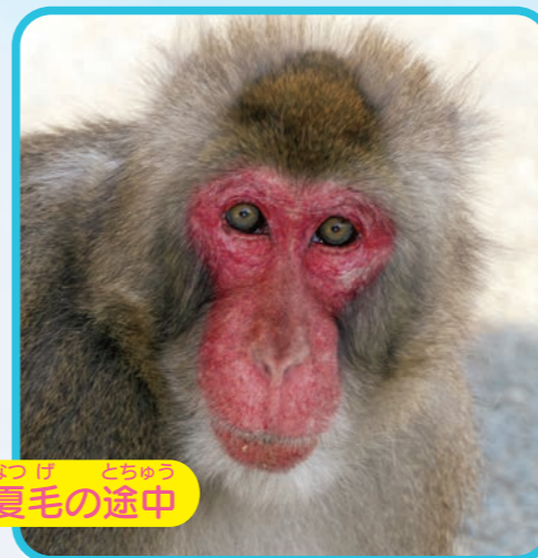
なつげ 夏毛の途中

サルは、夏になると長い毛が抜けて短い毛に生 え変わります。これがサルの衣替えです。夏、 サルたちにとって1年に1度の衣替えの季節で す。新しい毛に生え変わると、サルの見た目は スッキリ。まるで別猿です。夏仕様に変身した サルたちを見に来てくださいね。